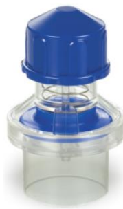
変更品 色 : 青色