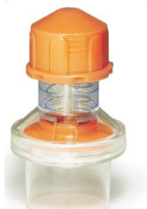
既存品 色 : オレンジ色